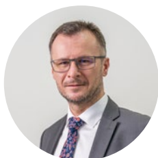
Zdeněk Nekula ministr zemědělství

O tom, že se tématu žen v zemědělství začíná věnovat více pozornosti, a to nejen u nás, svědčí například, že se Mendelova univerzita v Brně zapojila do evropského projektu FLIARA. Ten se v deseti zemích zaměřuje na posílení role žen v zemědělství a venkovském životě, a to za aktivní účasti farmářek i venkovských podnikatelek. Tým MENDELU se prioritně zapojuje do řešení problematiky role žen v inovacích potřebných pro udržitelné zemědělství a venkov. Jeho cílem je získané zkušenosti následně využít pro místní podmínky. „Respektujeme a oceňujeme roli generací předkyň, které hrály klíčovou roli v udržování venkovského života, víme, že role žen je klíčová pro přítomnost i budoucnost,“ řekl Ciarán Ó hÓgartaigh, rektor irské Univerzity Galway, která stojí v čele projektu. S tím nelze než souhlasit.