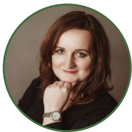
MILADA RAŠKOVÁ MĚSÍKOVÁ