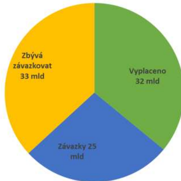
Čerpání PRV (celkové veřejné výraje v Kč)