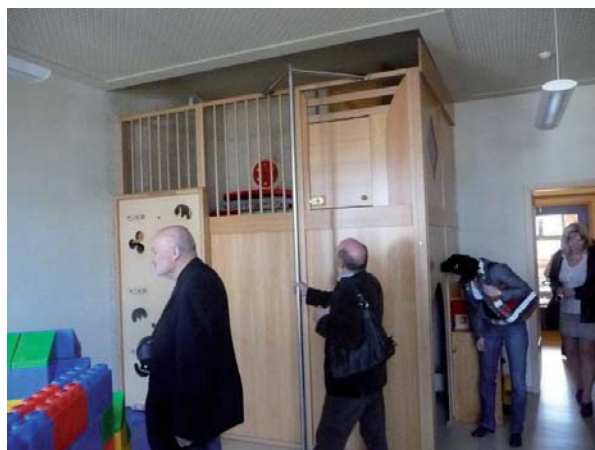
Exkurze 22. - 25.3.2011 - Německo, Oederan ot. Gahlenz