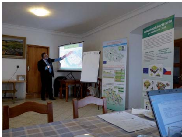
Školení pro veřejnou sféru 8.4.2011 - Valeč

Na konci roku 2011 byla dokončena realizace mezinárodního vzdělávacího projektu Hovořme s venkovskými lidmi, podporujeme jejich vzdělávání, ale především jim naslouchejme (ČR – KMAS – MAS SERVISIO, PMAS - MAS Vladař, PMAS - MAS CÍNOVECKO, Finsko – PMAS - LAG Aktiivinen Pohjois-Satakunta ry, SRN – PMAS - Verein zur Entwicklung der Vorerzgebirgsregion, Augustusburger Land a.V.). Více informací a fotografií naleznete na webu projektu www.hovormeanaslouchejme.cz .