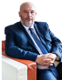
Miroslav Toman ministr zemědělství

Tématem, kterému jsme se poslední lednové pondělí v Bruselu věnovali, byla i takzvaná Zelená dohoda pro Evropu. Ta má představovat zásadní strategii pro přechod do roku 2050 na klimaticky neutrální a udržitelnou ekonomiku bez emisí skleníkových plynů. Záměrem je stanovit ambiciózní cíle EU v oblasti životního prostředí a klimatu tak, aby se spravedlivě zapojily všechny členské státy. Důležité je zvýšit úsilí, prevenci i připravenost v řešení problému ohledně změny klimatu. Udržitelné hospodaření a posílení biodiverzity vnímáme jako hlavní priority, a proto vyšší ambice v oblasti klimatu a životního prostředí podporujeme. Ale úroveň ambicí EU nesmí ohrozit konkurenceschopnost českých zemědělců a omezit výrobu. U nás dojde po roce 2020 k posílení požadavků standardů Dobrého zemědělského a environmentálního stavu půdy, a to především s ohledem na zachování zásob uhlíku a podporu jeho ukládání. Zemědělci budou například muset zachovávat trvalé travní porosty na základě poměru k zemědělské ploše či vhodně chránit mokřady a rašeliniště.